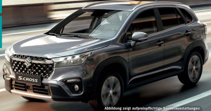
Abbildung zeigt aufpreispflichtige Sonderausstattungen.

Der Suzuki S-Cross. Macht Sinn, macht Laune.